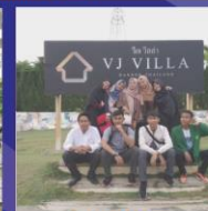
MAGANG TERINTEGRASI KKN DI THAILAND