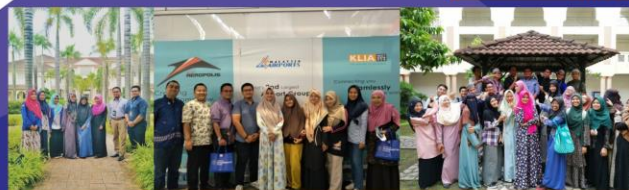
STUDENT MOBILITY DI KOLEJ UNIVERSITI ISLAM ANTARABANGSA SELANGOR MALAYSIA