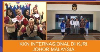
KKN INTERNASIONAL DI KJRI JOHOR MALAYSIA